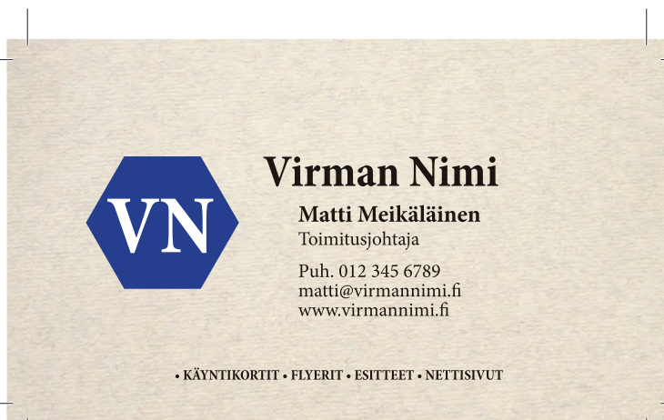
Kortti bleedin ja leikkausmerkkien kera

Korttia suunnitellessa kannattaa asettaa 2-3mm marginaali. Näin kortissa oleva asia, kuten teksti tai logo ei asetu liian lähelle leikkausrajaa. Konekaan ei osaa leikata aina täydellisesti ja paperi "elää" leikkauskoneessa.