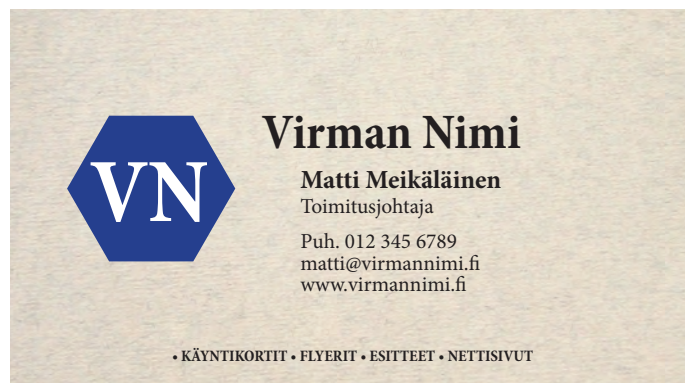
Kortti leikattuna (50x90mm)

Teemme käyntikorttien suunnittelutyötä sekä muuta graafista suunnittelua! Kysy lisää sähköpostilla myynti@kopio-raksa.fi tai soittamalla 017 822 727